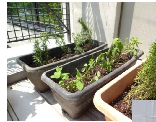
(大葉・ハーブなど)